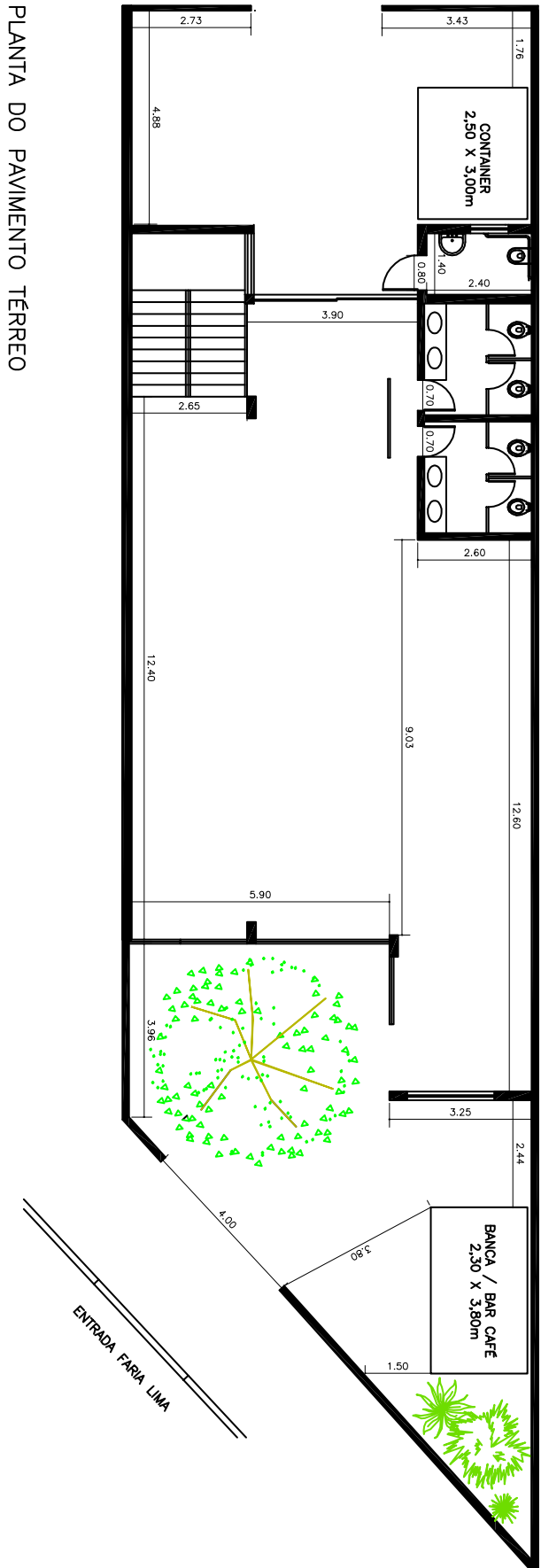
PLANTA DO PAVIMENTO TÉRREO